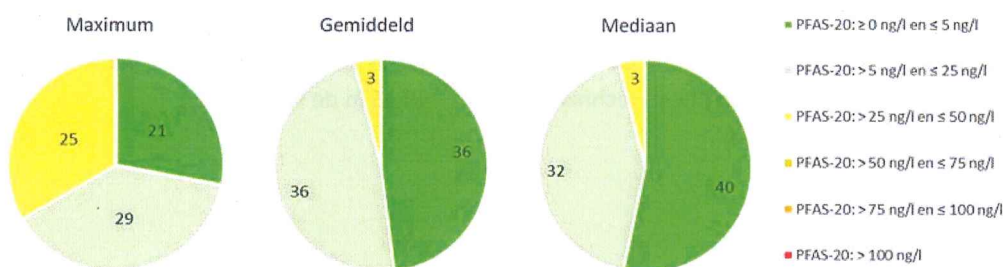
figuur 1: kwaliteitsverdeling voor PFAS-20 opgedeeld in de 75 leveringsgebieden

De nieuwe Europese drinkwaterriichtlijn (EU 2020/2184) neemt PFAS op als 'nieuwe' drinkwaterparameter. Uit dit onderzoek blijkt dat het Vlaamse drinkwater overal voldoet aan de Europese norm voor de 20 meest relevante individuele PFAS (PFAS-20). De maximale concentratie ligt overal in Vlaanderen onder de helft van de Europese drinkwaternorm.